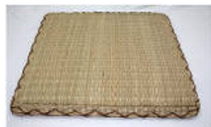
39-041 (40入) (40×40×2.5) (角座布団小 薄) ¥ 1,900