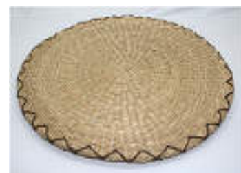
39-031 (40入) (φ40×2.5) (丸座布団小 薄) ¥ 1,900