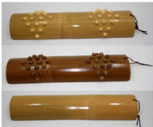
39-883 (33) (玉入踏み竹 白) ¥ 1,000