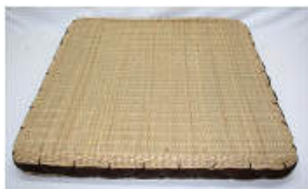
39-010 (30入) (45×45×4) (角座布団 厚) ¥ 2,300