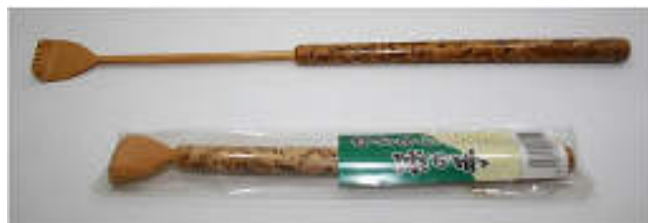
35-200 (21⇔34) (のびのび孫の手) ¥ 250