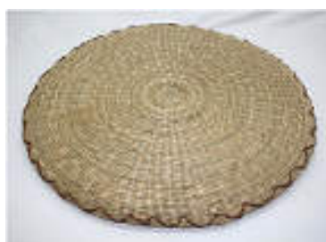
39-030 (36入) (φ45×2.5) (丸座布団大 薄) ¥ 2,100