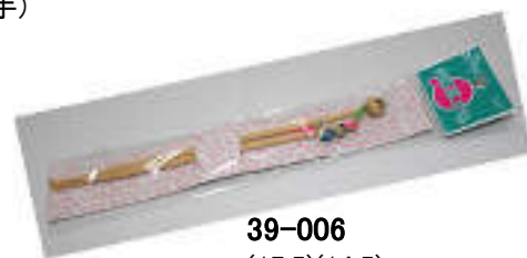
39-006 (17.5)(14.5) (夫婦耳かき) ¥ 200