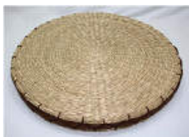
39-020 (30入) (φ45×4) (丸座布団 厚) ¥ 2,400