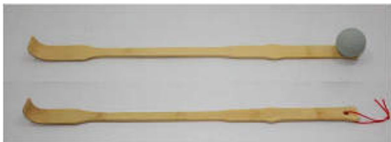
35-190 (47) (ボール付孫の手) ¥ 400