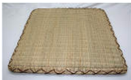
39-040 (36入) (45×45×2.5) (角座布団大 薄) ¥ 2,000