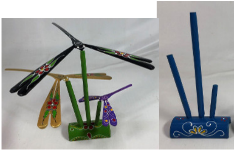
67-004 (3.5×7×15) (竹とんぼヤジロベエ 飾り台) ¥300