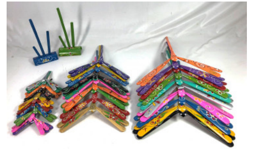
67-003 (9×7) (竹とんぼヤジロベエ 小) ¥250