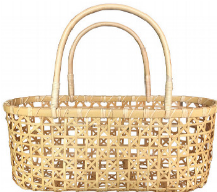
17-030-1 (16×37×14)×29 (晒竹小判手付籠 大) ¥12,000