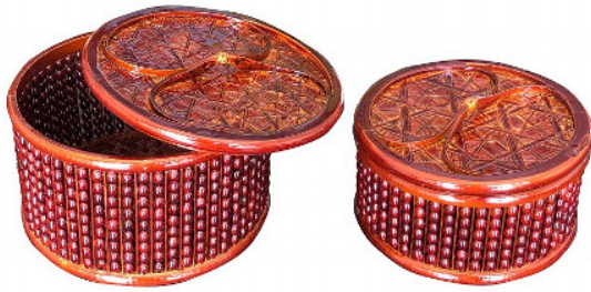
16-923-1 (φ16×10) (玉付ヒゴ丸型菓子器蓋付 大) ¥3,200