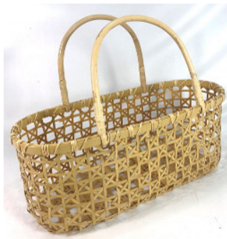
17-030-2 (14.5×34×13.5)×27 (晒竹小判手付籠 小) ¥11,000