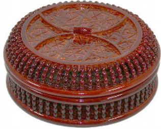
16-910-1 (φ24×9.5) (玉付ヒゴ菓子器蓋付 大) ¥3,400