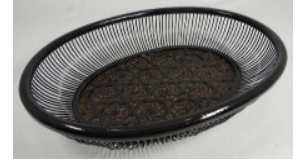
16-921-1 (17.5×22.5×4.5) (流水盛 小判 小) ¥2,000