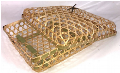
16-005-1 (21×21×5) (六ッ目弁当箱 大) ¥1,200