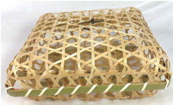
16-005-2 (16×16×4.5) (六ッ目弁当箱 小) ¥1,100