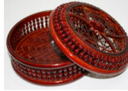
16-911-1 (φ11.5×7) (玉付ヒゴ丸蓋付 小) ¥1,800