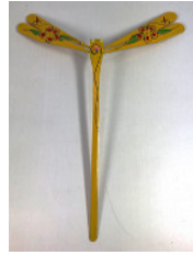
67-001 (20×19) (竹とんぼヤジロベエ 大) ¥350