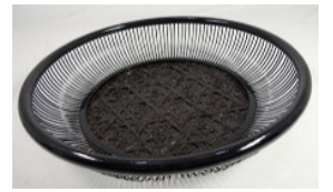
16-920-1 (φ20×4.5) (流水盛 丸 小) ¥2,000