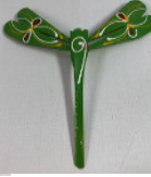
67-002 (16×15) (竹とんぼヤジロベエ 中) ¥300