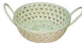
18-613 (120入) (φ22×8) (パーム丸手付 小) ¥700