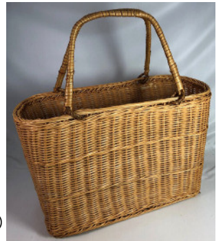
44-264 (12入) (19×36×25)×42 (籐角長バッグ) ¥4,600