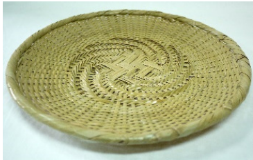
15-518(φ18×2) ¥3,500 15-521(φ21×2) ¥3,600 15-524(φ24×3) ¥3,700 15-527(φ27×3) ¥4,100 15-530(φ30×3) ¥4,500 (青竹山路ザル)