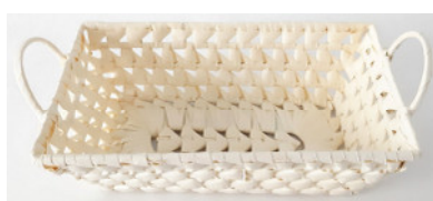
18-618 (150入) (18×28×8) (パーム角長手付 中) ¥800