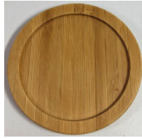
25-260 (φ8) (竹コースター丸) ¥350