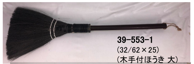
39-553-1 (32/62×25) (木手付ほうき 大) ¥950