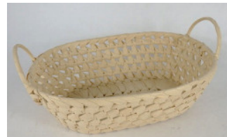
18-686-1 (120入) (16×22×7.5) (パーム小判手付 小) ¥670