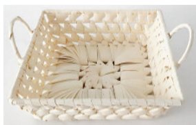
18-616 (150入) (21×21×8) (パーム角手付 中) ¥700