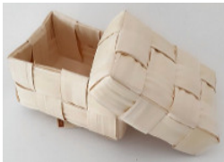
18-625 (160入) (8×10×5.5) (パームボックス 小) ¥450