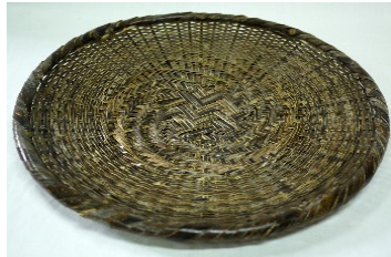
15-618(φ18×2) ¥3,700 15-621(φ21×2) ¥3,900 15-624(φ24×3) ¥4,100 15-627(φ27×3) ¥4,500 15-630(φ30×3) ¥4,800 (黒竹山路ザル)