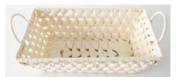
18-619 (150入) (15×25×8) (パーム角長手付 小) ¥650