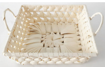
18-615 (120入) (24×24×9) (パーム角手付 大) ¥870