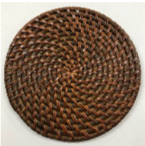
34-015-3 (φ15) (籐マット塗 15cm) ¥550