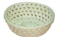
18-620 (180入) (φ18×6) (パーム丸 小) ¥500