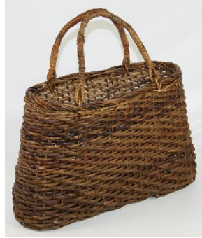
39-955 (24入) (13×37×23)×36 (手提籠カズラゴザ編小判) ¥3,600