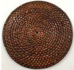
34-020-3 (φ20) (籐マット塗 20cm) ¥650