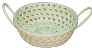
18-612 (100入) (φ25×8) (パーム丸手付 中) ¥770