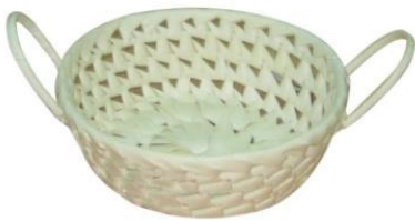
18-611 (80入) (φ30×9) (パーム丸手付 大) ¥970