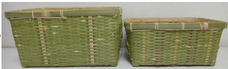
50-504 (40入) (20.5 × 28 × 13) (青竹角長籠 小) ¥ 2,000