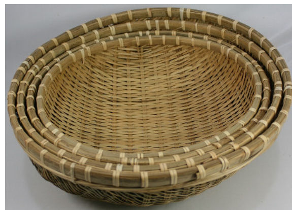
50-710 (10S/4) -1(φ 42 × 14) -2(φ 39 × 13) -3(φ 36 × 12) -4(φ 33 × 11) (当て縁揚げザル4入 小) ¥ 5,200