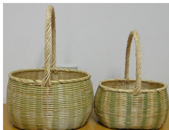
50-744 (20S/2) -1(21 × 26 × 17) × 36 -2(17 × 21.5 × 13.5) × 30 (青小判手付籠) ¥ 3,200