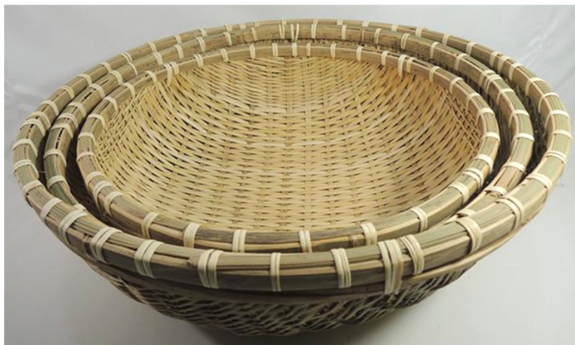
50-459 (6S/3) -1(φ 55 × 18) -2(φ 50 × 17) -3(φ 45 × 16) (当て縁揚げザル3入) ¥ 6,400