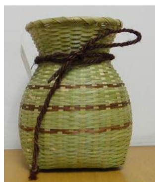
50-287 (32入) (φ 18 × 28) (ピク線入) ¥ 1,600