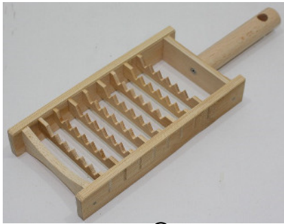
30-130 ㊦ (9×27) (鬼おろし 丸柄) ¥2,030