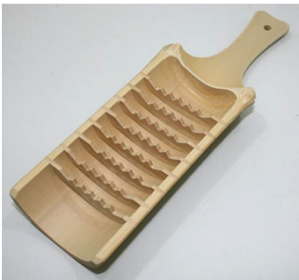
30-075 ㊦ (9×29) (竹鬼おろし 穴なし) ¥2,280