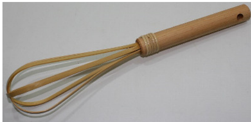
30-160 ㊦ (φ6×29) (米とぎマドラー) ¥920