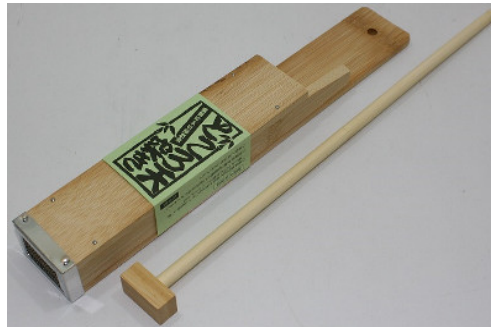
30-142 ㊦ (5×3.5×20)×32 (ところ天突き 大) ¥2,320