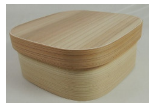
30-906 (16×16×6.5) (杉曲げワツパ弁当箱 角) ¥3,100