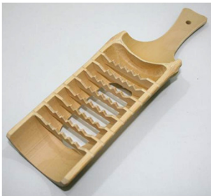
30-074 ㊦ (9×29) (竹鬼おろし 穴開き) ¥2,420