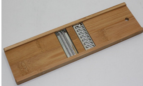
30-143 ㊦ (7.5×25.5) (野菜調理器 両刃) ¥1,950