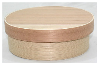
30-902 (15×18.5×6.5) (杉曲げワツパ弁当箱 中) ¥2,900