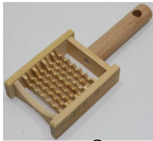
30-131 ㊦ (7×17.5) (ミニ鬼おろし) ¥1,600