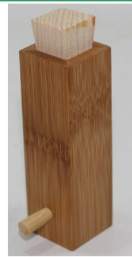
30-140 ㊦ (3×3×11) (スス竹七味入) ¥850