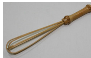
30-161 ㊦ (φ2×14.5) (根竹マドラー) ¥460