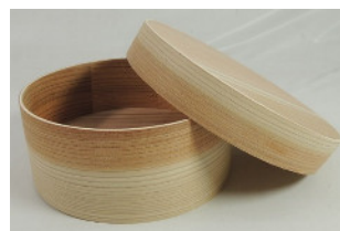
30-904 (φ15×6.5) (杉曲げワツパ弁当箱 丸) ¥2,800