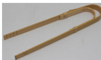
37-504 ㊤ (18) (曲がりトング) ¥870