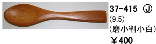
37-415 ㊤ (9.5) (磨小判小白) ¥400