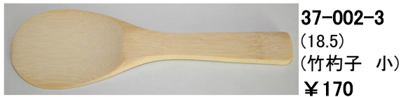
37-002-3 (18.5) (竹杓子 小) ¥170