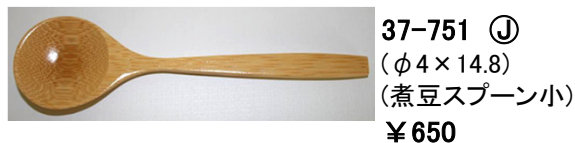
37-751 ㊤ (φ4×14.8) (煮豆スプーン小) ¥650