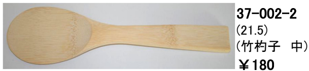
37-002-2 (21.5) (竹杓子 中) ¥180