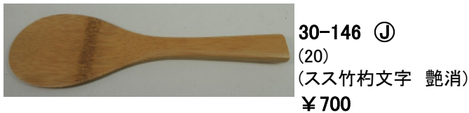
30-146 ㊤ (20) (スス竹杓文字 艶消) ¥700