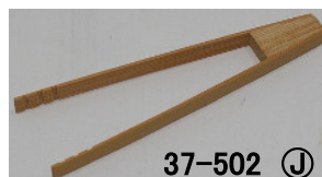
37-502 ㊤ (12) (ミニトング) ¥490