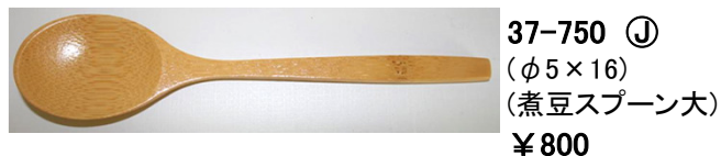
37-750 ㊤ (φ5×16) (煮豆スプーン大) ¥800