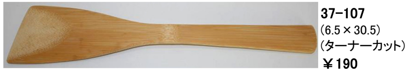
37-107 (6.5×30.5) (ターナーカット) ¥190