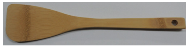
30-147 ㊤ (30) (スス竹ターナー 艶消) ¥1,000