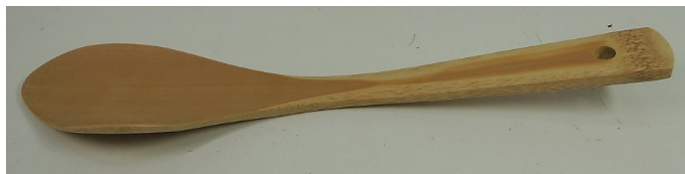
30-148 ㊤ (29.5) (スス竹炒飯ヘラ) ¥1,500