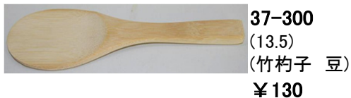
37-300 (13.5) (竹杓子 豆) ¥130