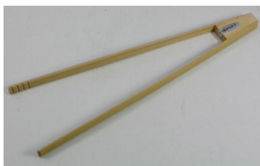
37-505 ㊤ (30) (天ぷらばさみ) ¥1,020