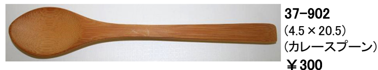
37-902 (4.5×20.5) (カレー Spoon) ¥300