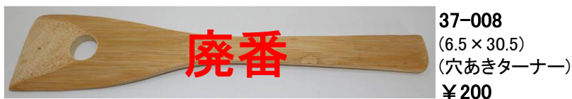
37-008 (6.5×30.5) (穴あきターナー) ¥200