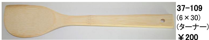
37-109 (6×30) (ターナー) ¥200