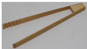
37-503 ㊤ (18) (晒アイストング) ¥870