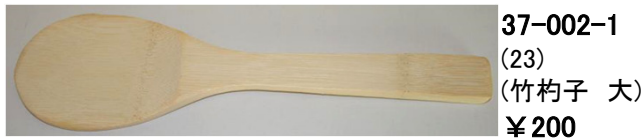
37-002-1 (23) (竹杓子 大) ¥200