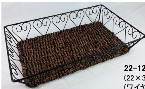
22-127 (40入) (22×34×6.5) (ワイヤーハートトレー 中) ¥2,000