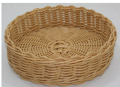
22-007 -1(φ23×8) ¥1,300 -2(φ20×6.5) ¥1,100 -3(φ17×6) ¥900 (ホリフﾟロピレン丸淵飾り)