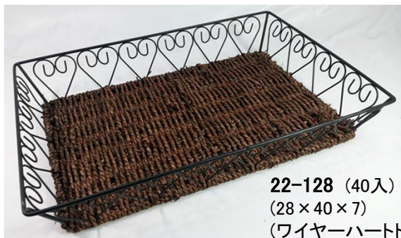
22-128 (40入) (28×40×7) (ワイヤーハートトレー 大) ¥2,200