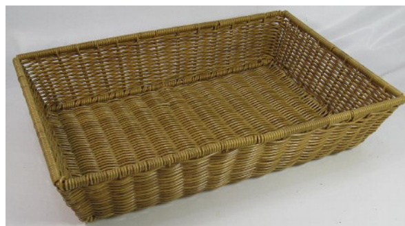
22-049 (30×40×8) (ホリフﾟロピレン角長容器) ¥2,400