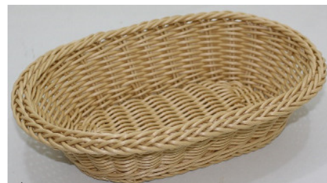
22-004 (20.5×28.5×6.5) (ホリフﾟロピレン小判) ¥1,700