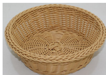
22-006 -1(φ21×7) ¥1,150 -2(φ17.5×5.5) ¥950 (ホリフﾟロピレン丸)