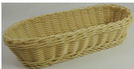
22-009 (11×25×6) (ホリフﾟロピレンカトラリー小判) ¥1,100