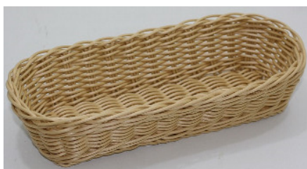
22-003 (11×26×6) (ホリフﾟロピレンカトラリー角長) ¥1,100