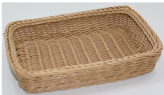
22-008 -1(22×31×7) ¥1,900 -2(19×27×6) ¥1,400 (ホリフﾟロピレン角長)