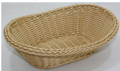
22-005 (21×30×9.5) (ホリフﾟロピレン小判舟型) ¥1,800